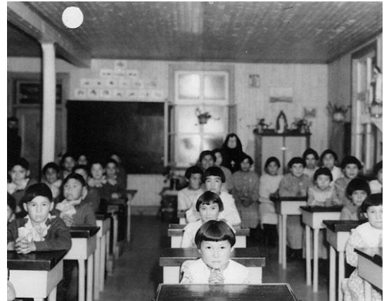
Enfants autochtones en salle de classe à l'école résidentielle catholique de Fort George (Québec), 1939

(Églises catholique, anglicane, méthodiste, unie et presbytérienne).